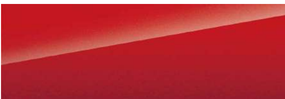
Emperor Red (Sonderausstattung)