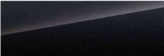
Silver sand black